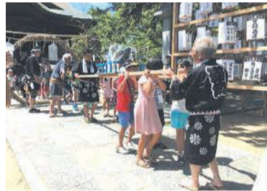
疫病退散の願いを込めて

舞鶴公園で本格バーベキューやマルシェ 舞鶴公園の三ノ丸広場(城内)に、市みどりのまちづくり協会が運営するバーベキューガーデンがあります。テーブル席や6人掛けのソファ席などがあり、食材を持ち込むことも、手ぶらで来て楽しむこともできます。