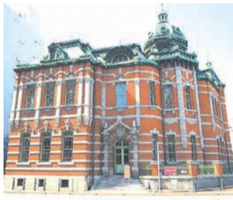
市赤煉瓦(れんが)文化館