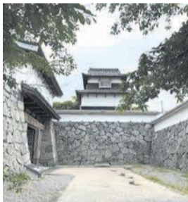
福岡城(伝)潮見櫓(やぐら)と下之橋御門