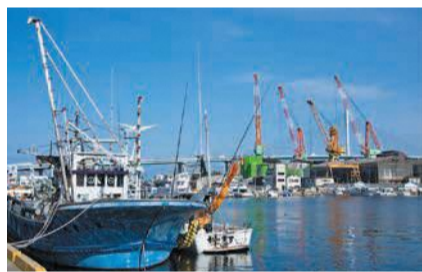
船を眺めてのんびり過ごせます

また、新鮮野菜や手作り菓子などを販売する「みどりのまちマルシェ」も行われています。 毎月第4土曜日の午前10時～午後2時(12月2月は休み) ☎舞鶴公園管理事務所 ☎781-2153 ☒715-7590