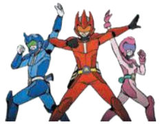
食中毒防止隊 タベルマン

8月1日(月)~26日(金)、あいれふ1階でプレゼント付きのタベルマンクイズラリーを実施します。また、「料理は科学実験だ」と題した動画を区ホームページなどで配信します。併せて、手洗いで細菌をやっつける決め技ポーズも募集しています。