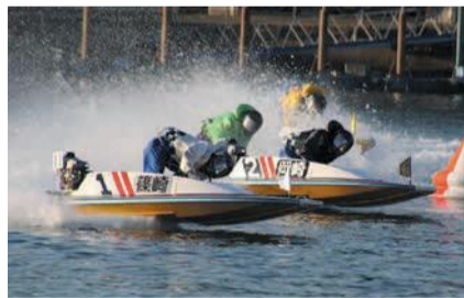
時速80kmで疾走するレースは迫力満点

が設置されています。その津と荒津を結び都市高速道路を支える荒津大橋は、中心の1本柱から出たケーブルで道路を支える美しい斜張橋です。橋のたもとには、化学薬品を運ぶタンカーやフェリーなどの各種船舶を造る福岡造船福岡工場があり、船やクレーンが力強くそびえています。荒津大橋と福岡造船は、それぞれ市の都市景観賞を受賞しています。