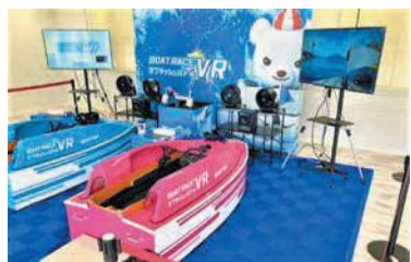
VR(バーチャル・リアリティ)アトラクション

屋外には、寝転んだり、遊んだりできる芝生広場があり、週末にはキッチンカーが出店します。また、レーザーになった気分を味わえるボートレース体験型VRアトラクションなどもあり、大人も子どもも楽しめる施設です。