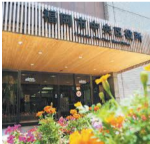
区役所の正面玄関