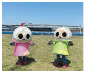
マスコットキャラクターのペラ坊とペラ美

週末には、正面のイベントホールで、ゲストを迎えてトークショーなどを実施しています。スタンドからは、最高時速80kmで疾走するボートのほか、福岡ポトタワいや都市高速道路、博多湾を発着する船など、海辺の爽やかな景色を眺めることができます。