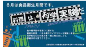
動画「料理は科学実験だ」のポスター