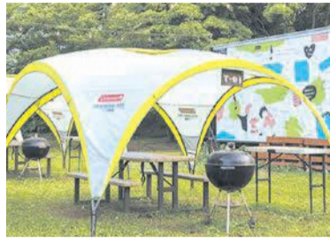
都心でバーベキューを楽しめます

鳥飼八幡宮の子どもみこしと夏越祭 鳥飼八幡宮(今川二丁目) 毎月第4土曜日の午前10時～午後2時(12月2月は休み) ☎舞鶴公園管理事務所 ☎781-2153 ☒715-7590