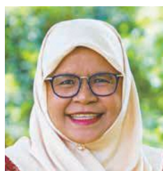
国連ハビタット事務局長 マイムナ・モハメッド・シャリフ氏