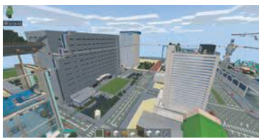
*マイクラフト=立体ブロックで構成された仮想空間の中で、自由にブロックを配置し、建物などを造って楽しむゲーム(画像はイメージ)

料5,000円 申7月11日(月)～24日(日)に市ホームページ(「福岡市 未来のまちづくりプロジェクト」で検索)で申し込みを(保護者の同意が必要)。