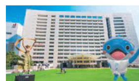
山笠バージョン(市役所西側ふれあい広場)

さらに、市内のみで撮影できる7月限定のシーライ山笠バージョンもあります。ぜひ撮影してツイッターなどSNSに投稿してください。詳しくは、ホームページ(「世界水泳福岡」で検索)で確認を。