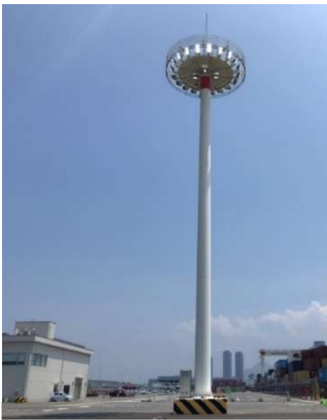
コンテナヤード照明の LED化