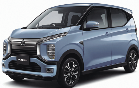
三菱 eKクロス EV