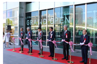
テープカットイメージ