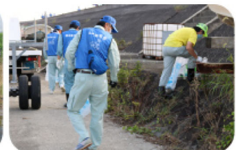
有明海クリーンアップ作戦