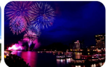
日田川開き花火大会(協賛)