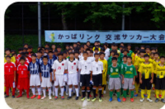
地域交流サッカー大会