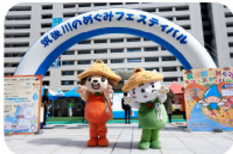
筑後川のめくみフェスティバル

都市圏と筑後川流域及び水源地域住民の相互理解を目的に、様々な交流イベントを実施しています。10月には、福岡市役所前広場にて筑後川のめくみフェスティバルを開催します。