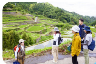
水源地での森林セラピー