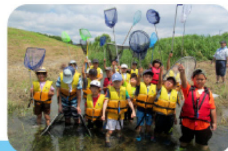
環境教育活動の様子

筑後川流域で環境保全・環境教育活動を行う団体への活動費助成や、筑後川流域で行われる一斉清掃活動への職員参加などを行っています。