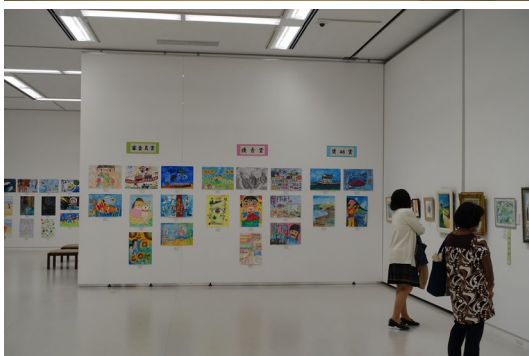
昨年度の美術作品展の様子