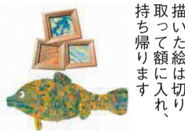
描いた絵は持ち帰ります

申 6月15日(水)から、ともてらす早良の窓口か電話、メール(info@tomoterasusawara.jp)で申し込みを。メールは、住所、参加者と保護者の氏名、電話番号、「おおきなえをかこう希望」と記入してください。