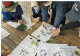
葉っぱあそび体験

脊振山登山や野外炊飯のほか、天体観察、施設内の植物をクイズ形式で学ぶグリーンアドベンチャー、間伐材を使ったクラフト教室など、晴雨を問わず脊振の自然と楽しく触れ合えるさまざまなプログラムが準備されています。