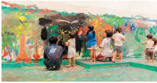
以前行われたワークショップ

絵本作家・なるかわしんごさんと一緒に、クレヨンで大きな絵を描きます。汚れてもよい服装で参加してください。