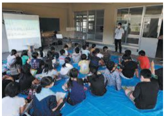
防災講座(内野小学校)

「自助・共助の重要性」について市民の皆さんの理解を深め、地域防災力の向上を図るため、避難行動要支援者名簿の活用に向けた説明会の実施や安全・安心フェスタを開催します。