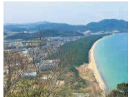
市街化調整区域に 立ち並ぶ住宅と長 浜海岸