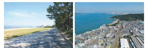
(左) マリナタウン海浜公園の浜辺 (右) 今宿の上空写真

「#f_nishista」のハッシュタグを付けて投稿された区内の写真を紹介しています。