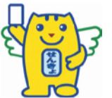
明るい選挙イメージキャラクター「選挙のめいすいくん」

7月25日の任期満了に伴い、参議院議員通常選挙が行われます。私たちの未来を決める大切な選挙です。忘れずに投票に行きましょう。