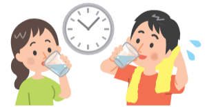
1時間ごとにコップ1杯、1日当たり1.2リットルが目安