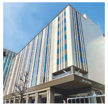
新庁舎は博多織の献上柄をモチーフにした外観が特徴

このほか、インターネットで予約した所得証明および軽自動車税(継続検査用)納税証明も取得可能です。※請求と受け取りは本人(個人)に限ります。