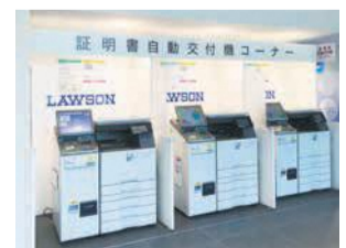
操作方法が分からない場合は、スタッフがサポートします

1階に自動交付機コーナーもあります。マイナンバーカード(4桁の暗証番号が必要)を持っていれば、住民票等の証明書が取得できます。