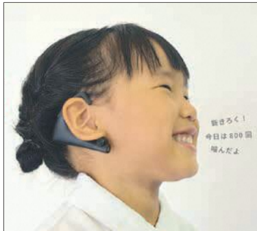
耳に掛けた咀嚼計で動きを測定します(イメージ画像)

とガムを活用した咀嚼力アッププロジェクトを、ロツテやシャープ、新潟大学、九州大学と連携して実施します。