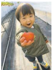
「大きなイチゴみつけた」 早良区 1歳