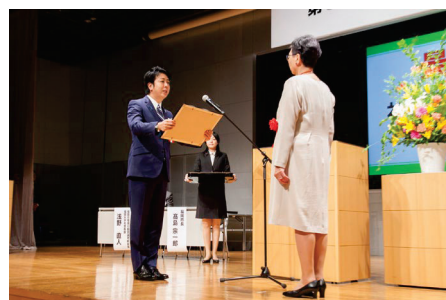
過去の表彰式の様子