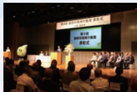
表彰式の様子（第9回）