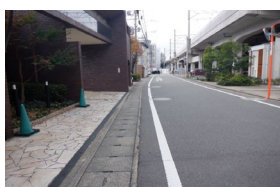
カラー舗装整備前