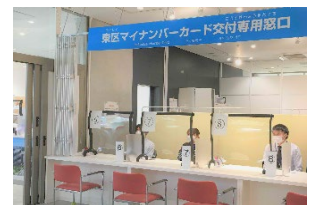
千早証明サービスコーナー