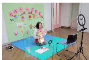
オンラインによる 子育てピギナース教室