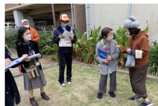
認知症声かけ模擬訓練