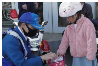
交通安全キャンペーン