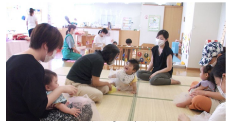
子どもプラザの様子

子どもが健やかに成長していけるよう、オンライン形式を含めた育児相談を幅広く実施するなど、妊娠期から子育て期にわたる切れ目ない支援を行い、安心して子育てができるまちづくりを推進します。