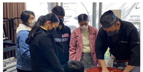
外国人と地域住民との交流

地域活動の担い手づくり、大学・NPO・企業などのまちづくり活動への参加や、外国人と地域住民の交流などを支援し、様々な主体が連携した共創のまちづくりを推進します。