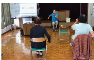
よかトレ実践ステーション