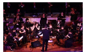
令和4年度の催しの様子