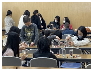
大学との共働による 公民館活動