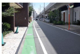
カラー舗装整備後