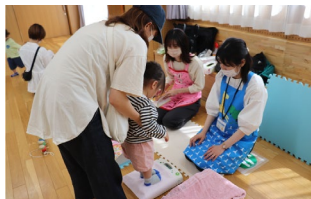
母子巡回健康相談