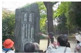
歴史ガイドツアー