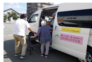
校区の買い物等支援の取組み