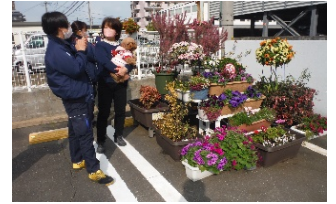
パートナー花壇への取材