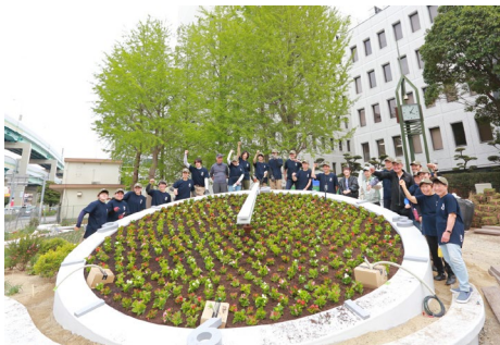
シンボルとなる花時計