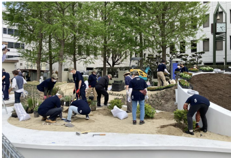
約600㎡もの花と緑の空間を協働で整備

この場所を「まち」の庭として、協働による「ひと」のつながり、そして次世代に向けた「とき」の連鎖を目指すまちづくりを实践