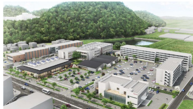
敷地全景イメージ