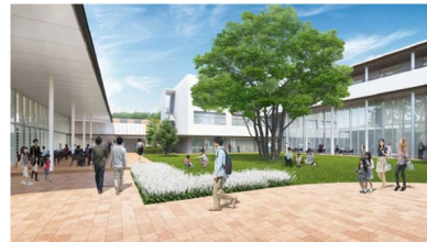
研究開発棟前の芝生広場イメージ