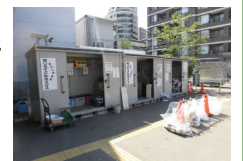
資源物回収ボックス (中央体育館)