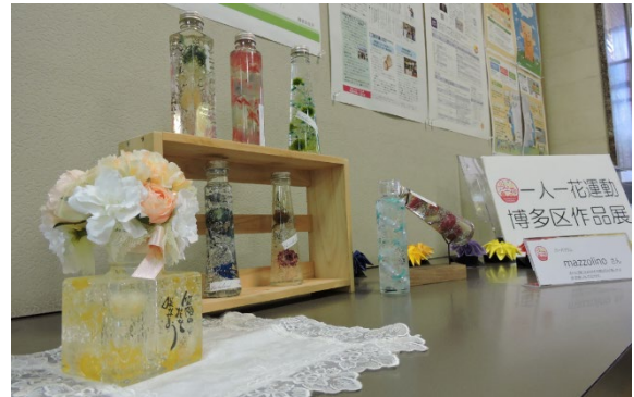
展示スペースの展示例