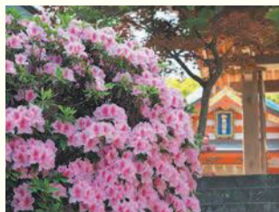
紅葉八幡宮のツツジ

開=日時 所=場所 問=問い合わせ ☎=電話 F=ファクス 対=対象 定=定員 料=料金、費用 持=持参 託=託児 申=申し込み 電=メール 開=開館時間 休=休館日