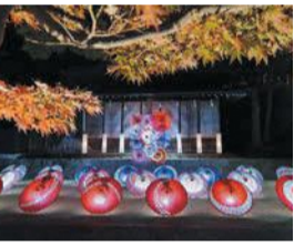
隊員が撮影した写真(令和2年11月取材)

「よかところ情報探検隊」は、区内の名所やイベントなどを市民の視点で取材するボランティアです。取材した内容や写真は、区ホームページやフェイスブックなどで紹介します。