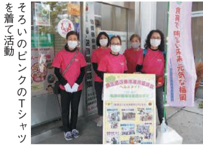
そろいのピンクのTシャツを着て活動

開=日時 所=場所 問=問い合わせ ☎=電話 F=ファクス 対=対象 定=定員 料=料金、費用 持=持参 託=託児 申=申し込み 電=メール 開=開館時間 休=休館日