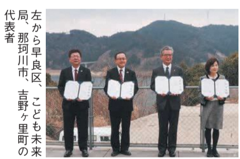
左から早良区、こども未来局、那珂川市、吉野ヶ里町の代表者

5月3日(火・祝)、4日(水・祝)に開催を予定していた「早良区西新演舞台」および「早良区どんたく隊パレード」は、新型コロナウイルス感染拡大防止のため実施を見送ります。 問 区企画課 ☎833-4412 F846-2864