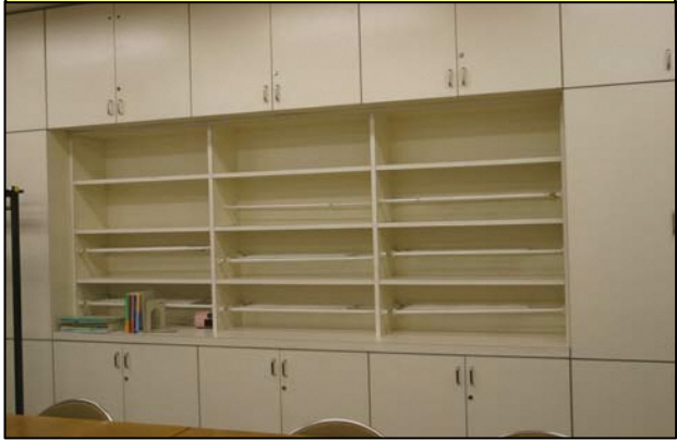
②壁面の保管棚 (アミカスネットルーム内)