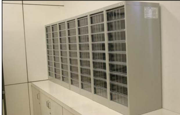
③メールボックス (アミカスネットルーム内)

1グループ1枠利用できます。 大きさは 巾291×奥330×874mm A4サイズの書類やチラシが入ります。 他のグループへの連絡用等に利用できます。