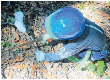
一生懸命落ち枝を切りました

☎=日時、開催日、期間 ☎=場所 ☎=問い合わせ ☎=ファクス ☎=対象 ☎=定員 ☎=料金、費用 ☎=持参 ☎=託児 ☎=申し込み ☎=メール ☎=ホームページ