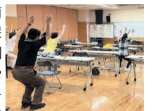
家でできる認知症予防運動

☎11月8日(火)、14日(月)、22日(火)の連続教室。午前10時～11時半 所 区保健福祉センター講堂 区地域保健福祉課 ☎559-5133 ☎512-8811 宛 全日程参加でき、医師から運動制限を受けていない65歳以上で、介護保険サービスを利用していない人。その他の詳細は同課にお問い合わせください。 宛 抽選15人 宛 無料 宛 9月16日(金)までに電話か、ファクスに本紙15面の応募事項を書いて同課へ。