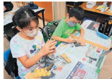
スプーン・フォーク作り体験