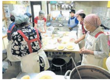
真心こめて食事を準備

食事の提供だけでなく、家で一人で過ごす時間が長く寂しい思いをしている子どもや、悩みを