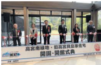
式典には、市長や貝島家関係者らが出席

西鉄高宮駅近くに位置する「高宮南緑地」と、その敷地内の「旧高宮貝島家住宅」がオープンし、3月31日に開園・開館式典が実施されました。