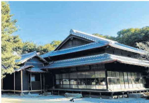
100年を超える歴史と風情が感じられます