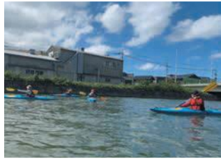
カヌーに乗ると、見慣れた景色も違って見えます

カヌーに乗って、那珂川の自然を満喫しませんか。福岡市カヌー協会のインストラクターが初心者にも丁寧に指導します。