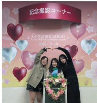
学生考案で「SNS映え」もばっちり

本館1階に、婚姻届や出生届の提出、南区での新生活の始まりなど、記念日にぴったりの撮影スポットを設置しました。