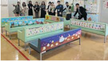
かわいいイラストで楽しい時間を