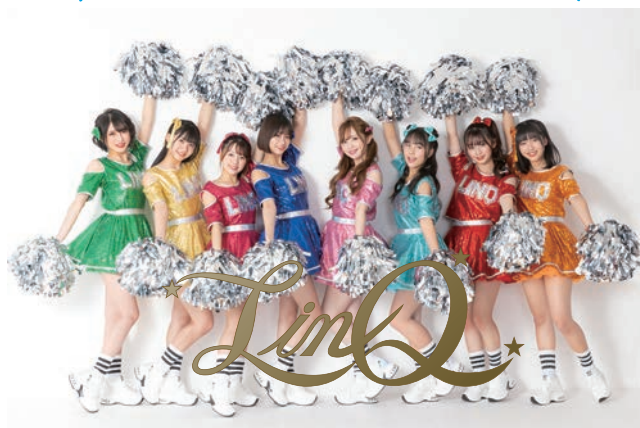
大会アンバサダー「LinQ」