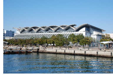
マリンメッセ福岡 A 館