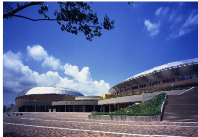
熊本市総合屋内プール(アクアドームくまもと)