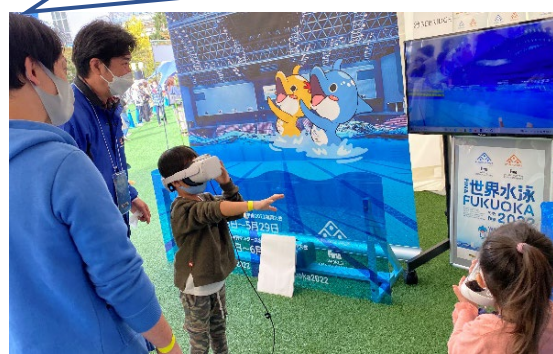
VR 体験イメージ(大会会場)

※ AR 体験には、スマートフォンに株式会社ビーブリッジ様(大会サポーター)のサービスアプリ「coconey(ココニー)」のダウンロードとアカウント作成(無料)が必要となります。