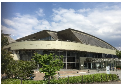
福岡市立総合西市民プール