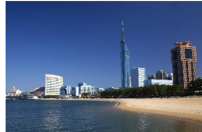
シーサイドももち海浜公園