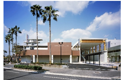
鹿児島市鴨池公園水泳プール