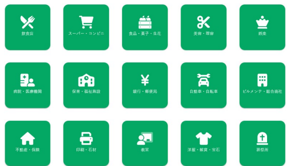
デジタルガイドマップの作成 【小笹商店会】 （令和3年度次世代商店街支援事業補助金）