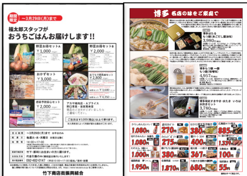
買い物サービス（宅配） 【竹下商店街振興組合】 （令和2年度）