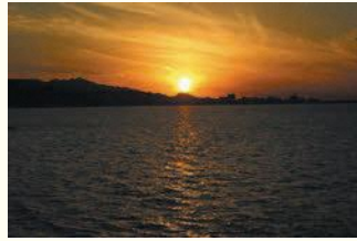
小戸公園の夕焼け