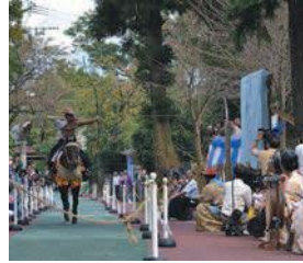
「文化の宝」である飯盛神社の流鏝馬(やぶさめ)

新型コロナウイルス対策のため、イベント参加時はマスクの着用や検温等体調確認へのご協力をお願いします。行事等が中止・延期となる場合がありますので、事前に各問い合わせ先へご確認ください。