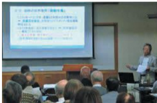
歴史について楽しく学びます

「不思議なお家騒動…福岡藩(黒田騒動)」をテーマに、西区まるごと博物館推進会員が話します。