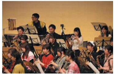
大人も子どもも楽しめます

感染症対策を行いながら、全日本吹奏楽コンクールで演奏した曲や有名なゲーム音楽等、たくさんの人に楽しんでもらえる曲を演奏します。