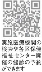
実施医療機関の検索や各区保健福祉センター開催の健診の予約ができます

①実施医療機関②各区保健福祉センター③西体育館(今年度のみ)④健康づくりサポートセンター※今年度はさいとぴあ健診が中止です。お近くの実施医療機関での受診をお勧めします。