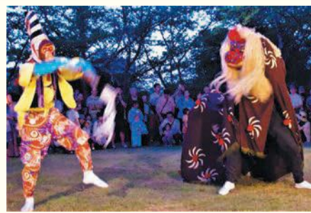
市指定無形民俗文化財 「宇田川原豊年獅子舞」