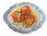
「ベジート」で食材を包み、栄養面と食べやすさを工夫