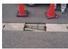
側溝・側溝蓋の破損についても連絡を

道路の破損、くぼみ、穴や照明灯の破損などを見つけたら、電話でご連絡ください。福岡市LINE(ライン)公式アカウントでも受け付けています。危険箇所の早期発見にご協力お願いします。