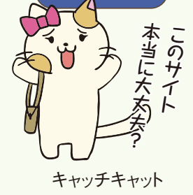
キャッチキャット