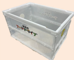
(2) 食品回収ボックス（運搬用）