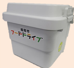
(1) 食品回収ボックス（設置用）