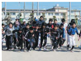
ウィンタースポーツフェスティバルではマラソンなどを実施