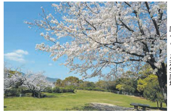
広々とした芝生広場

広場には、子どもが楽しめる滑り台や複合遊具がたくさんあります。カフェレストランも併設され、大人から子どもまで一日中公園