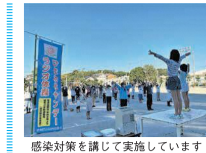
感染対策を講じて実施しています