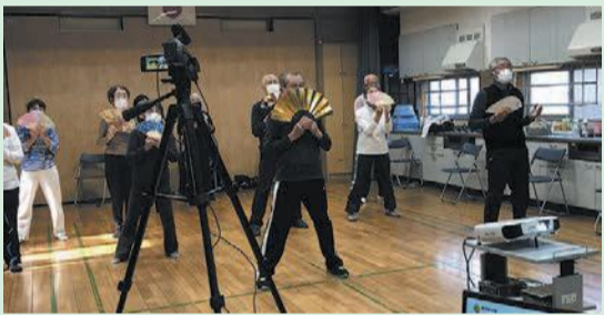
閩別府公民館 ☎821-7489 F821-2308

別府公民館の職員は、「コロナ禍で整備したオンライン環境は公民館にとって貴重な財産です。今後も積極的に活用していきたいです」と語りました。