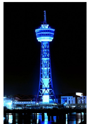
博多ポートタワーライトアップの様子