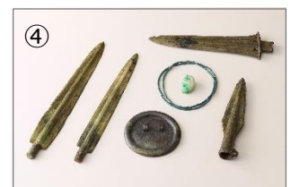
「日本最古の王墓」 吉武高木遺跡 3号木棺墓出土遺物

弥生時代を特徴づける「モノ」として「青銅器」があります。福岡は、日本でも有数の青銅器出土量を誇ります。本展は、福岡出土の弥生時代の青銅器を一堂に展示する貴重な機会となります。