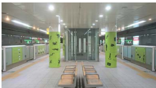
( 六本松駅/科学館前 )