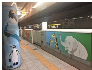
( 薬院大通駅/動植物園口 )

上記装飾内容について、完成時期は3月25日を予定しております。なお、以下の日程で、取材いただけますので、是非とも取材方よろしくお願ひします。