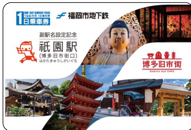
( 特別デザイン1日乗車券 )

※画像はイメージであり、実際のものとはデザイン・仕様が一部異なる場合がございます。