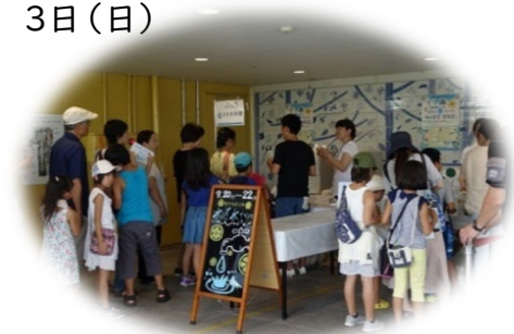
イベントイメージ