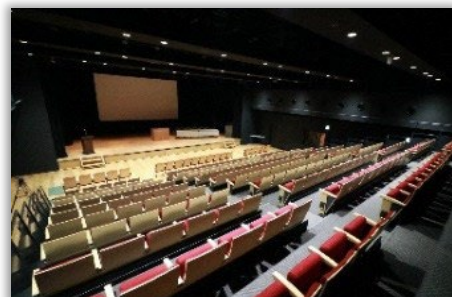
福岡市科学館(サイエンスホール)