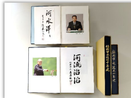
福岡市水道50年史、70年史