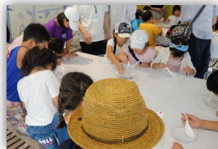
ワークショップイメージ