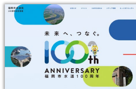
特設サイト メインビジュアル