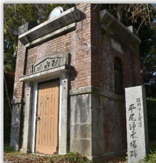
植物園にある 平尾浄水場遺構