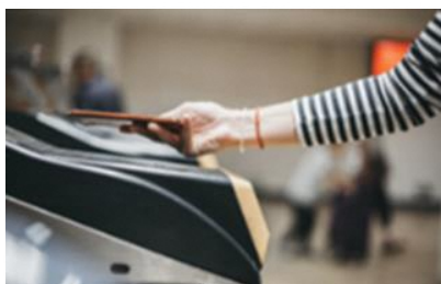
(タッチ決済利用イメージ図：Visa 提供)

Visa のタッチ決済は、世界で約 500 以上の公共交通機関に導入されている*など、一般的な乗車方法として認知されています。（*2021 年年次報告書による）近年、国内においても、南海電気鉄道株式会社や横浜市営バスなどで実証実験が行われていますが、 地下鉄では今回が日本初の取り組み で、「 交通系 IC カードとタッチ決済の一体型自動改札機 」による実証実験は国内の全交通事業者でも初の取り組みとなります。