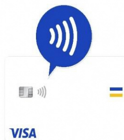
〔対応カードの一例〕