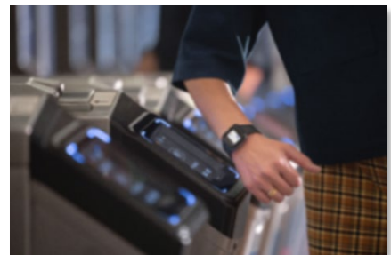
(タッチ決済利用イメージ図)