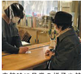
来館時に日常の様子や健康のことを話します

金山校区では、コロナ禍の中、高齢者の健康づくりと見守りを兼ねた取り組みや、子どもたちに地域活動を学んでもらうための工夫した取り組みが行われています。