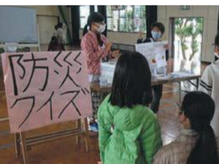
「防災クイズ」コーナー。親子で一緒に考えていました