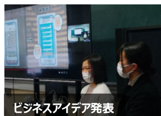
ビジネスアイデア発表