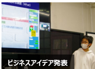
ビジネスアイデア発表