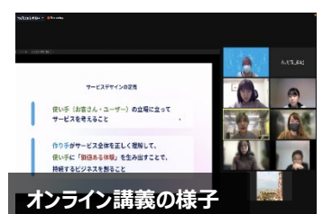
オンライン講義の様子