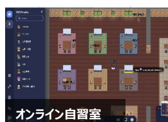
オンライン自習室