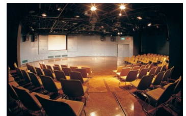
アクロス福岡 円形ホール