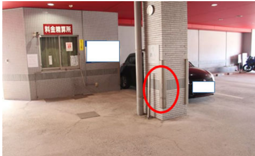
市側車両損傷箇所写真