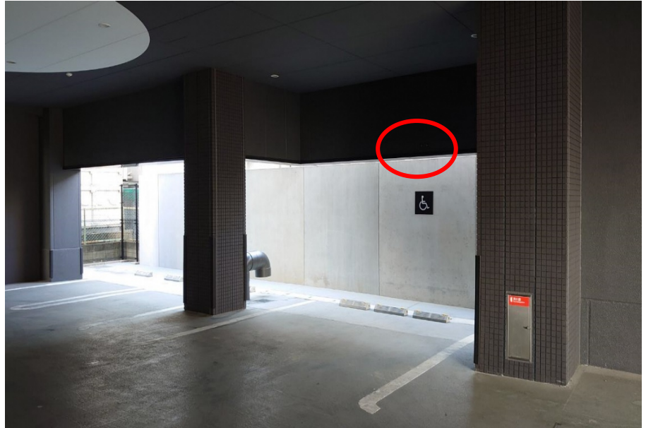
市側車両損傷箇所写真