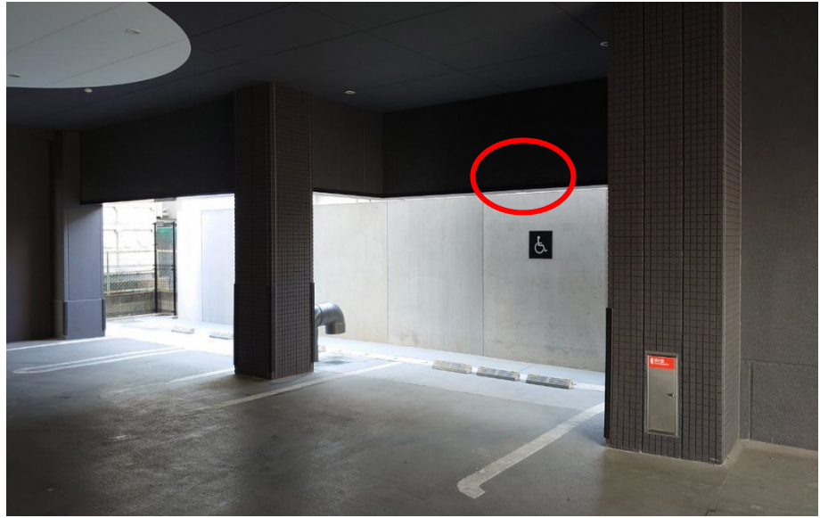
市側車両損傷箇所写真