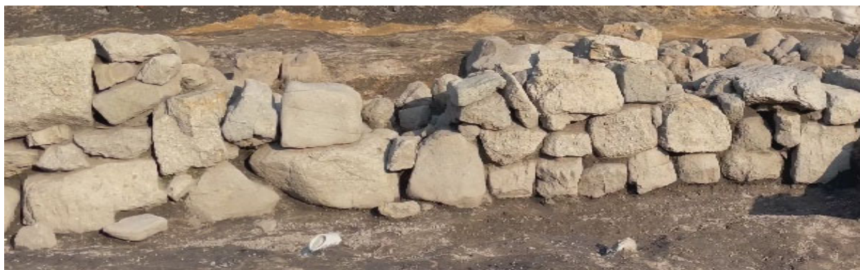
石積み遺構（正面から）