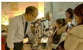
体験学習室のイベント「君も考古学者！」

市内学校への出前学習、校外学習や他都市からの修学旅行の受入れを頻繁に実施している。また、体験を通じて歴史文化に親しめる体験学習室は多くの人に利用されている。