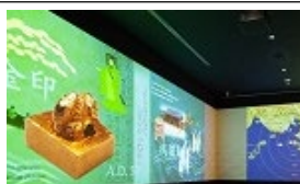
常設展示室の導入部分