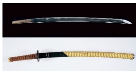
国宝 刀 名物「庄切長谷部」 金襴絞打刀拵