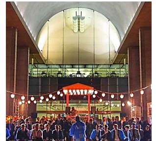
第12回アジア太平洋都市サミット (フェアウェルパーティー)