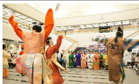
エントランスでの古代衣装ファッションショー

建物は、MICE関連企画や様々なイベントの舞台としても活用され、外構は、緑豊かな憩いの空間として親しまれている。