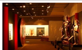
特別展「九州仏」(平成26年度)