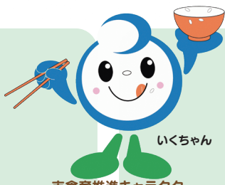
市食育推進キャラクター

色の濃い野菜(小松菜、カボチャ、水菜など)には、日本人に不足しがちな カルシウム もたっぷり！