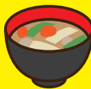
具たくさんのみそ汁