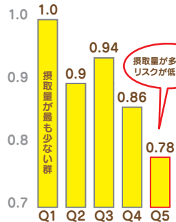
(参考 国立がん研究センター)

男性で野菜全体の摂取量が最も少ない群(Q1)に比べた場合の最も多い群(Q5)のリスクは0.78と統計学的有意に低く、摂取量が多いほどリスクが低い傾向がみられました。