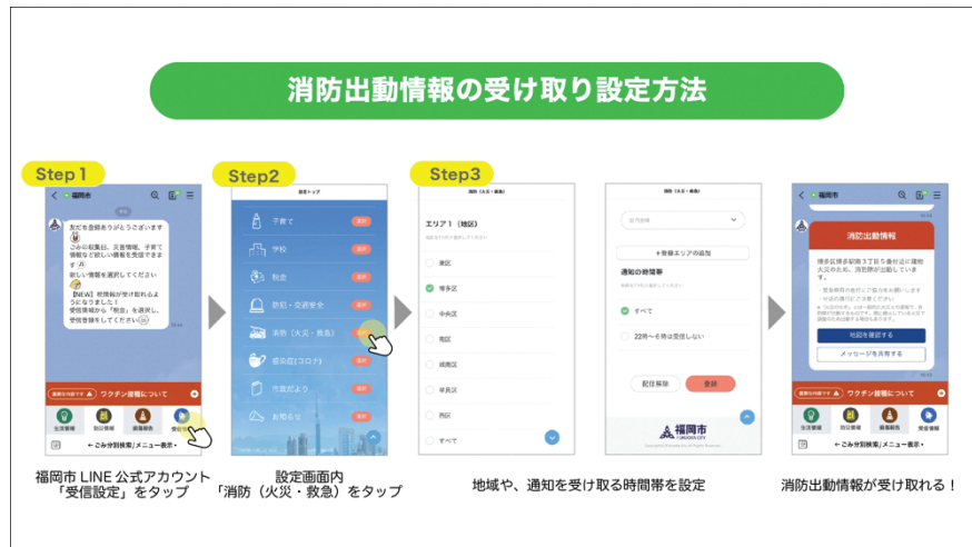
消防(火災・救急)情報の受け取り設定方法

また、離れて暮らす家族の住む地域や子どもの学校の地域の情報といった、自分の居住地以外の地域の消防情報も簡単に受け取ることが出来るようになることや、LINE 上の友だちへ簡単に情報を共有できることで、緊急時における互助・共助の活性化も期待できます。