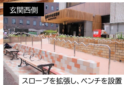
スロープを拡張し、ベンチを設置

玄関前広場の植栽や壁を撤去し見通しを良くすることで、歩行者や自転車が安全に通行できるようになりました。また、ユニバーサルデザインに配慮して、スロープの拡張や、手すり・ベンチを設置しています。