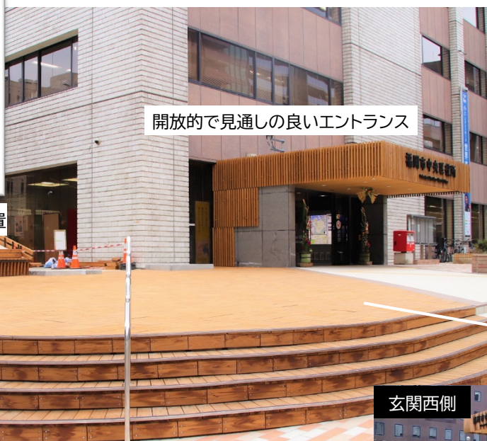
開放的で見通しの良いエントランス