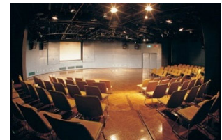
アクロス福岡 円形ホール

※新型コロナウイルス感染症の状況により、オンライン配信のみになる可能性があります。