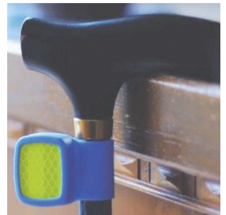
専用シリコンケース マグネットクリップ型 (880円 [税込])

見守り端末1個につき「専用シリコンケース：ストラップ型」が1つ付属します。 くつ型、マグネットクリップ型などのシリコンケースは、otta.shop ( https://otta.shop/ )にてお買い求めいただけます。