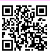
FUKUOKA 愛 PROJECT ホームページ

このプロジェクトでは、投稿された動画を編集で一本につなぎ、世界一長い「フラワーバトン動画」の製作を目指します。詳しくは、別紙②または当プロジェクトホームページをご覧ください。