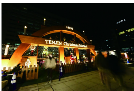
クリスマスマーケット会場